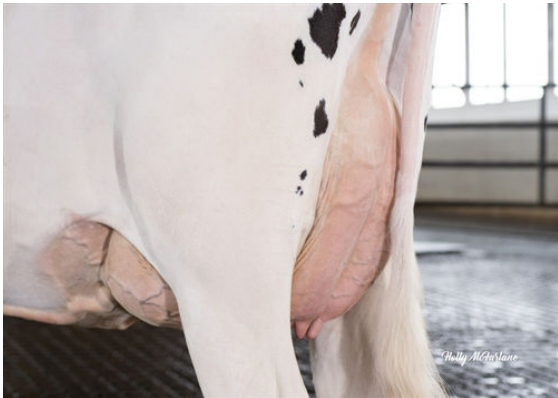
STANTONS TOPNOTCH TALENT GRANDDAM