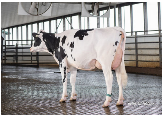
STANTONS TOPNOTCH TALENT GRANDDAM